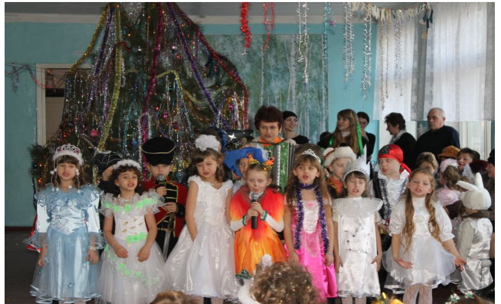
Новогодний утренник в Беловодской средней школе

вы- нуть к че- му-то плохому, не замечать серьезные недостатки. Космин был человеком умным. Он тогда не просто призвал прихожан внести пожертвования на иконостас, он обратился к ним с пожеланием, чтобы они не забывали и о своем внутреннем мире. Ведь в душе каждого человека хотя бы периодически должно происходить очищение и обновление. Вот на такое обновление и хочется обратить внимание беловодчан, особенно молодежи. Может, последние и не знают, но в XIX веке именно молодежь являлась двигателем истории в Российской империи, именно она несла в народ самое передовое и прогрессивное, выступая одновременно главным оппозиционером царскому режиму. У нас в Украине в настоящее время также, кажется, не все благополучно в государстве. И хотя происходят некоторые колебания во внутренней и внешней политике, особенно это почувствовалось после ухода с политической арены Ющенко, но нельзя же, действительно, верить в то, что, стоящие за спинами Президента и премьер-министра олигархи, – эти ненасытные механические роботы – пойдут на серьезные уступки в социальной сфере, больше начнут думать о проблемах простого народа, чем о своем бизнесе. Поэтому фронт работы для активных членов общества обширный. Не надо только спать и быть послушным орудием в руках власть предержащих. В былые времена Беловодщина всегда проявляла себя с самых революцион-