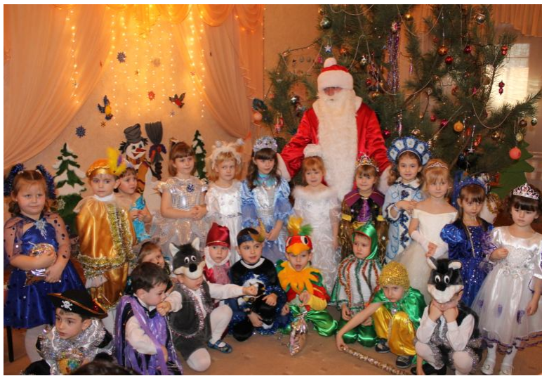
Посещение Дедом Морозом детского садика № 3